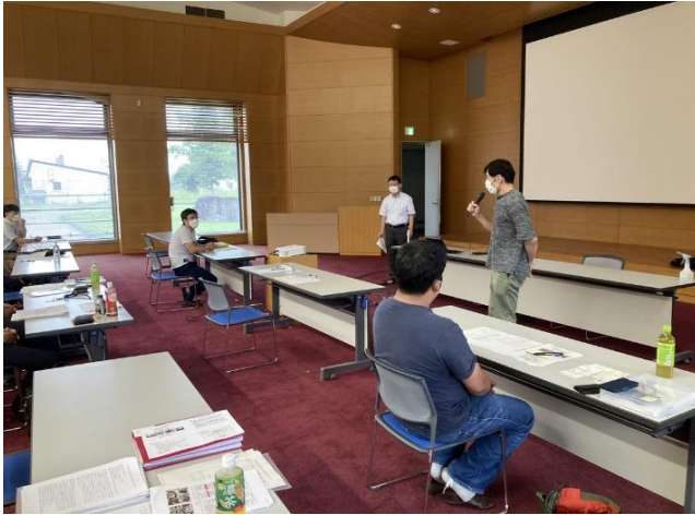
受講生による自己紹介