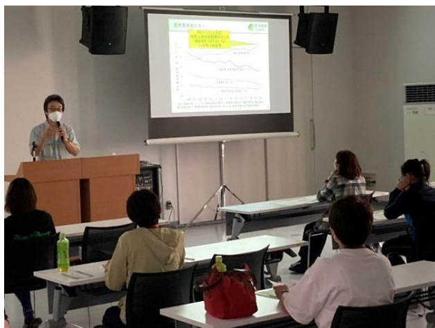
農作業安全についての講演

なお、研修会での農研機構・積グループ長補佐による「農作業安全」についての講演の様子は、YouTube内のホクレンアグリポートチャンネルで今後公開します。