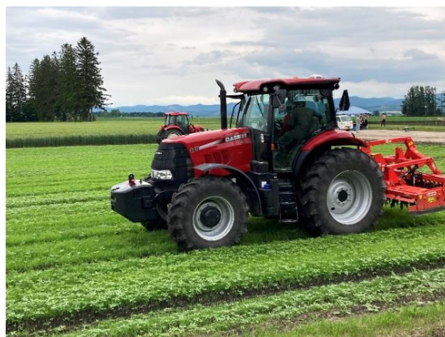
自動操舵トラクターの体験試乗