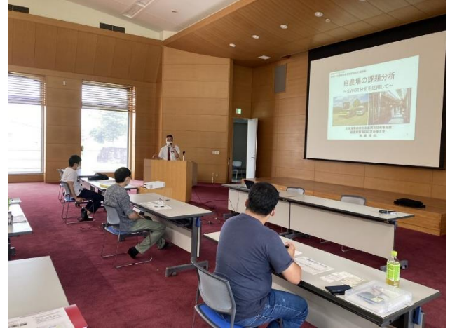
自家産の課題分析講義