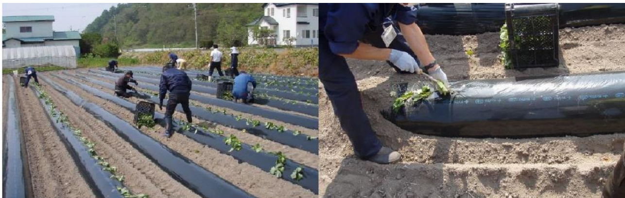
さつまいもの定植の様子

今年の試作圃場は7カ所で、5月23日より定植を開始し、6月11日までに完了しました。品種は、ベニアズマ、ベにはるか、シルクスweetの3種です。今後は、圃場管理、生育調査などを継続し、10月頃の収穫を見込んでいます。収穫物は、種いもや調査用のサンプルを除き、実販売も実施する予定です。