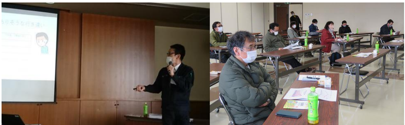
中標津支所営農支援室から従業員の定着促進に向けたポイントの説明

講習会では、第一次産業ネットを運営する株式会社 LifeLab から、求職の応募数増加への効果的な Web 求人広告掲載方法の紹介がありました。また、ホクレン中標津支所営農支援室から従業員の定着促進に向けたポイントなどを説明しました。今後も求職者の応募増加と定着促進の一助となる取り組みを継続していきます。