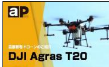
共通情報（スマート農業等）（橙色）