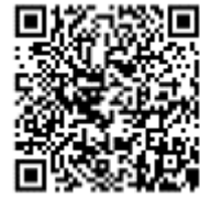
アグリポートチャンネル 2次元コード