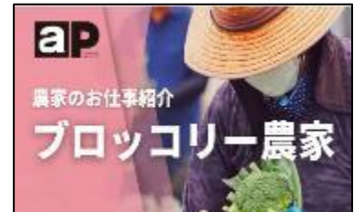
その他情報（レシピ等）（ピンク色）