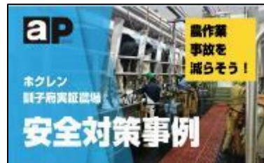
畜産農家向け情報（水色）