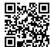
「農薬散布ドローンの基礎知識」資料2次元コード