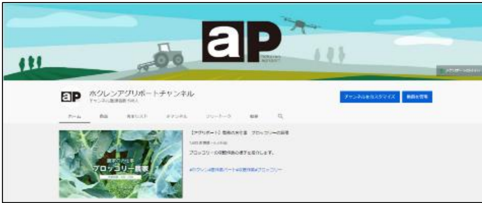
アグリポートチャンネル チャンネルアート