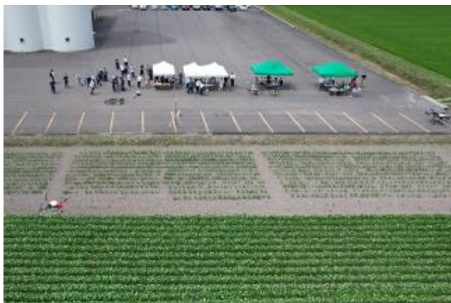
ドローン実演飛行の様子

7月13日にJAきたそらちスマート農業技術研究会主催で、ホクレン岩見沢支所営農支援室協賛による農薬散布ドローンの実演会を開催しました。生産者、関係機関を含め約80名が参加しました。ホクサン株式会社、WorldLink & Companyほか各社から、XAG社 P-30、DJI社 AGRAS T20 (K)、株式会社NTT e-Drone Technology社 AC101などのドローンが出展され、営農形態に合うドローンがどれかを考える機会を提供できました。各社のドローンの特徴については、アグリポート別冊リーフレット「農薬散布ドローンの基礎知識」をご覧ください。