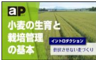
耕種農家向け情報（黄緑色）