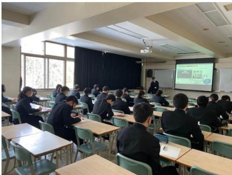
帯広農業高等学校での農業講習会

将来の担い手である農業高校生との取り組みを今後も継続し、北海道農業への理解促進を目指していく予定です。