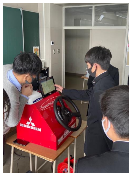
自動操舵トラクターデモ機の操作