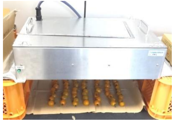
近赤外光照射の様子

食品流通研究課では、この技術の開発元である株式会社四国総合研究所と共同研究を進めています。そのなかから、ミニトマトでの試験結果をアグリポート 28 号（12 月 1 日発行）で紹介しています。ぜひご覧ください。