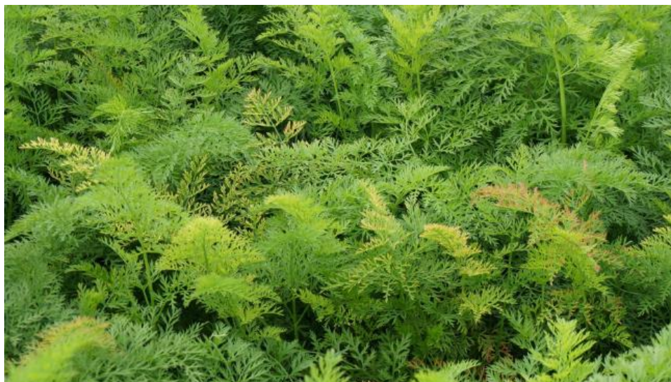
ニンジン黄化病による赤化・黄化症状

す。詳しくはアグリレポート 25 号（6 月 1 日発行）に掲載していますので参考にしてください。