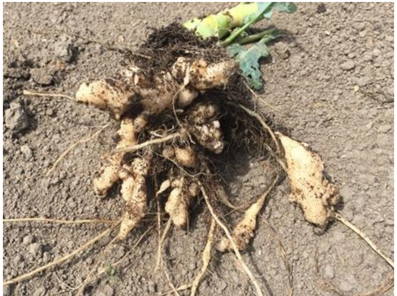
根こぶ病にかかったブロッコリー

ホクレン札幌支所では、ブロッコリーの産地化を進めるJA北いしかりと生産部会、農業改良普及センターと連携し、根こぶ病の菌密度を測定する土壌診断や、そ