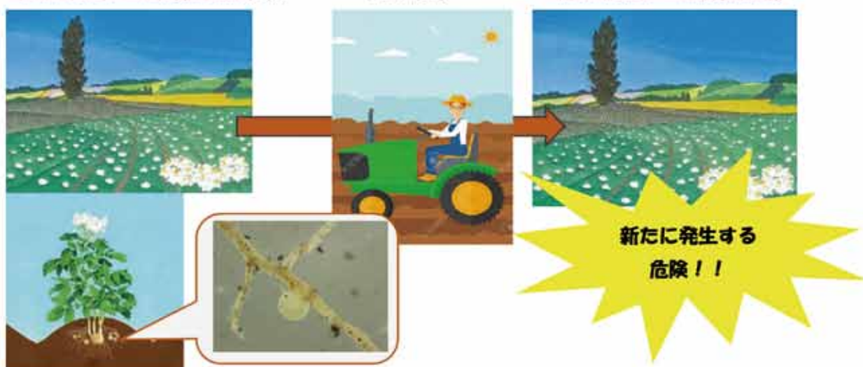
（シストセンチュウ未発生ほ場）

芦別市は未発生地域であるため、芦別市ジャガイモシストセンチュウ対策協議会では、ジャガイモシストセンチュウ侵入対策の取組を実施しております。