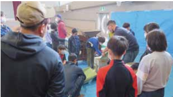
上芦別小 脱穀体験