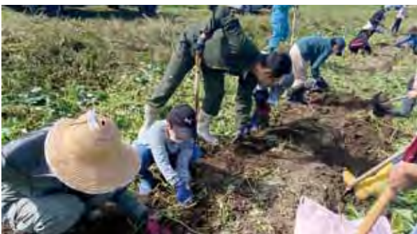
江部乙小 さつまいも収穫