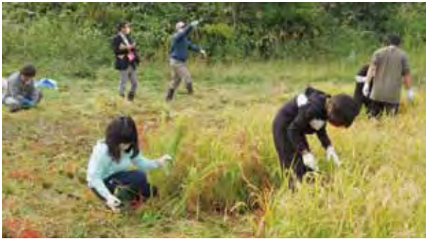
上芦別小 稲刈り体験