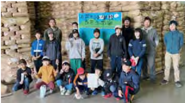
上芦別小 米施設見学