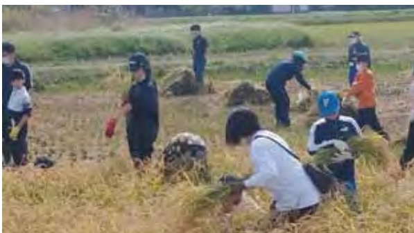
滝川西小・第一小 稲刈り体験