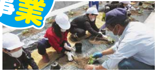
若別小 メロン定植・観察体験