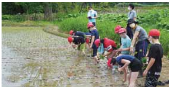
上若別小 田植え体験